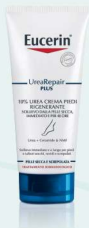
CREMA PIEDI UREA REPAIR PLUS EUCERIN Solievo immediato e 48 ore di libertà dai sintomi della pelle secca, molto secca e tesa di piedi e talloni. Leviga i talloni con calli ed ispessimenti, 100 ml