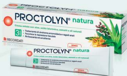
PROCTOLYN NATURA Crema rettale con aloe, acido ialuronico estratti e oli naturali con 3 azioni per il trattamento di sindrome emorroidaria e ragadi anali, 30 ml