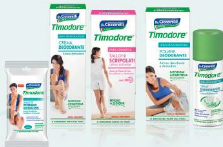
LINEA TIMODORE soluzione ideale per combattere il fastidioso problema dell'eccessiva sudorazione e cattivo odore del piede