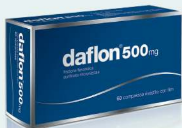
DAFLON 60 compresse rivestite 500 mg