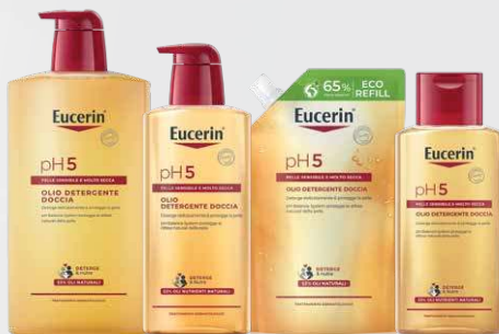
EUCERIN PH5 OLIO DETERGENTE DOCCIA