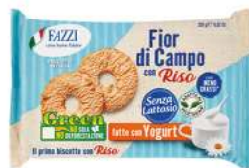
FAZZI BISCOTTI CON RISO E CON YOGURT 250 G