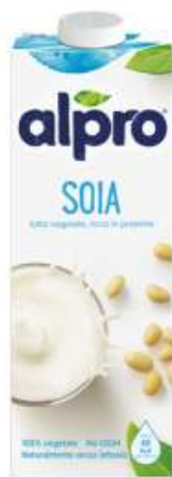
ALPRO SOIA ORIGINAL BEVANDA DI SOIA 1 L