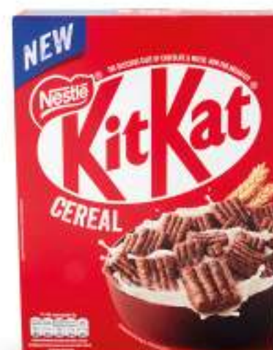
KITKAT CEREALI 330 G