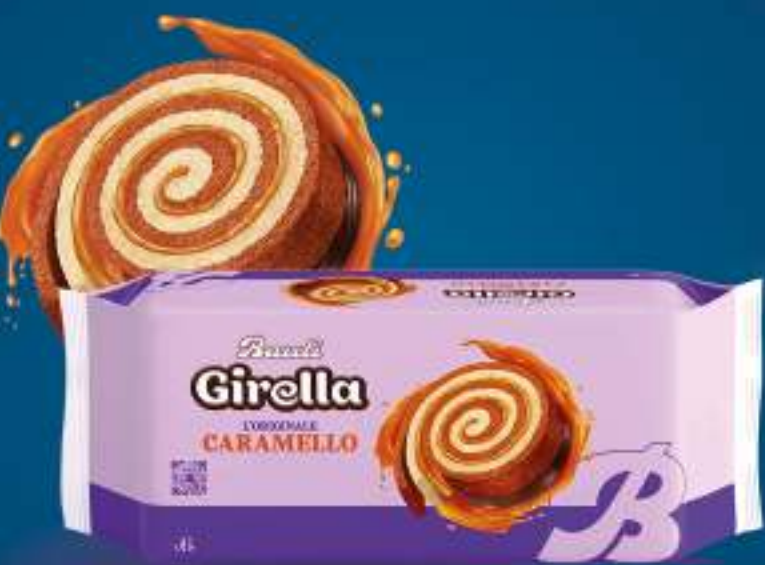
BAULI GIRELLA CARAMELLO 210 G