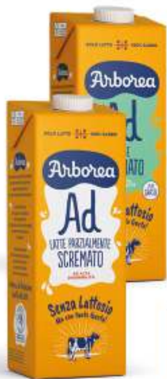
ARBOREA LATTE UHT SENZA LATTOSIO • PARZIALMENTE SCREMATO • SCREMATO 1 L