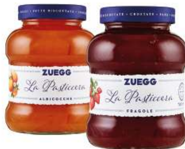
ZUEGG CONFETTURA VARI GUSTI 700 G