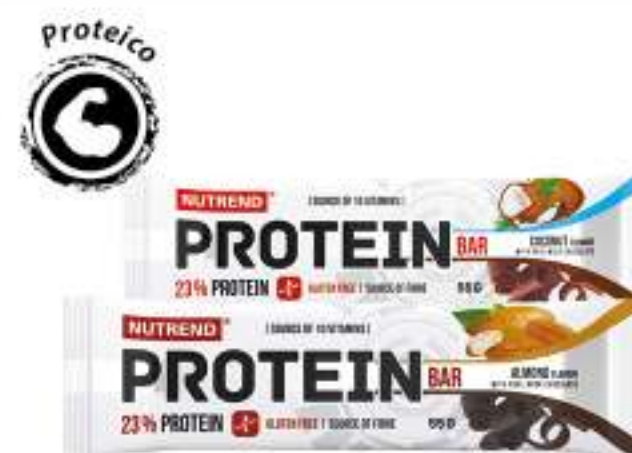
NUTREND PROTEIN BAR BARRETTE • CIOCCOLATO E COCCO • MANDORLA • CIOCCOLATO • FRUTTI DI BOSCO 55 G