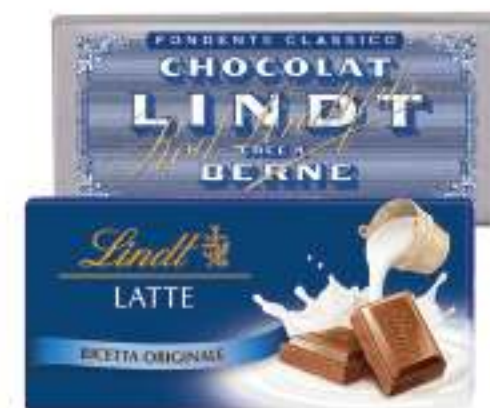
LINDT TAVOLETTA DI CIOCCOLATO • LATTE • FONDENTE 100 G