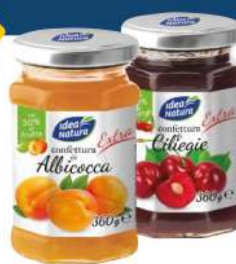
IDEA NATURA CONFETTURA EXTRA VARI GUSTI 360 G