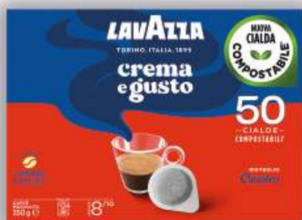
LAVAZZA CREMA&GUSTO ESPRESSO CLASSICO 50 CIALDE