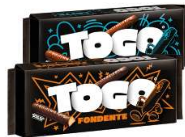
PAVESI TOGO BISCOTTI RICOPERTI CON CIOCCOLATO • LATTE • NOIR 120 G