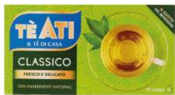
ATI TÈ • VERDE • NERO 25 FILTRI