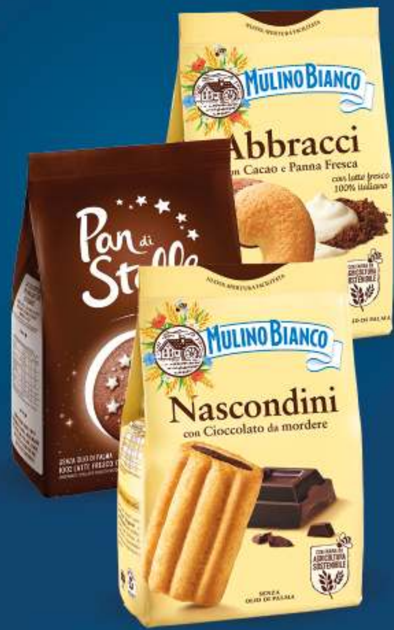
MULINO BIANCO BISCOTTI • PAN DI STELLE • ABBRACCI • BATTICUORI 350 G • NASCONDINI 330 G