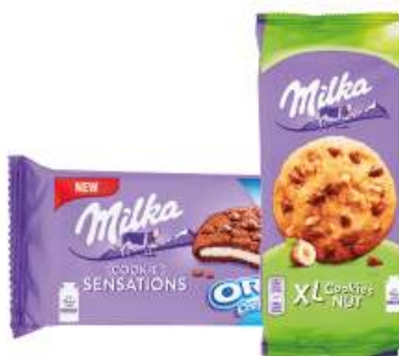
MILKA BISCOTTI VARI TIPI VARIE GRAMMATURE