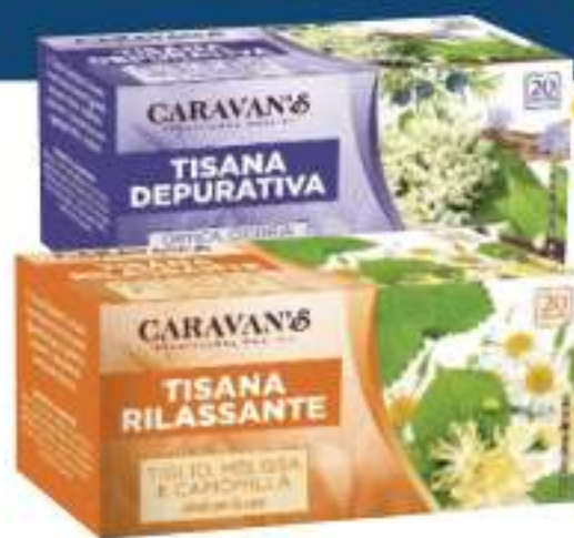
CARAVAN'S TISANA • RILASSANTE • DOPO PASTO • DEPURATIVA 20 FILTRI