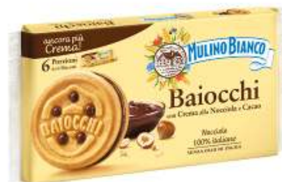
MULINO BIANCO BAIOCCHI SNACK ALLA NOCCIOLA 56 G X 6