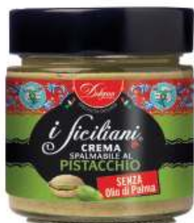
I SICILIANI CREMA SPALMABILE AL PISTACCHIO 200 G