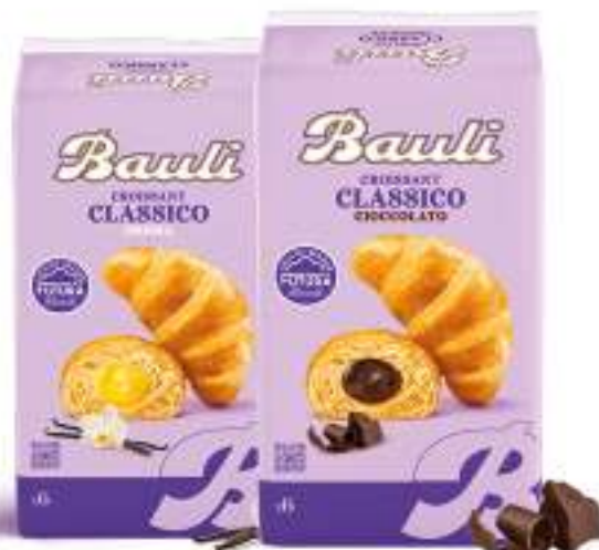
BAULI CROISSANT VARI GUSTI 250/300 G