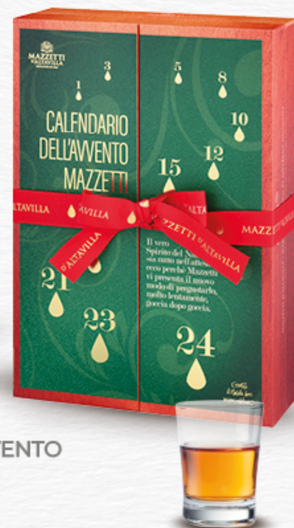
MAZZETTI CALENDARIO DELL'AVVENTO LIQUORI MIGNON CL 2 X 24

La tradizione di scoprire ogni giorno cosa è nascosto dietro alla finestrella, è un modo piacevole per aspettare l'arrivo del Natale, cedendo per un attimo ad un piccolo peccato di gola o di vanità.