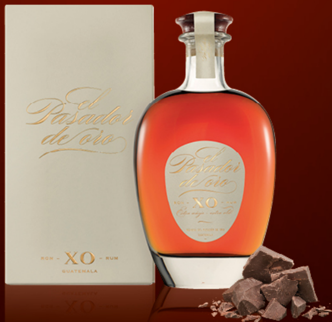
EL PASADOR DE ORO RUM XO CL 70