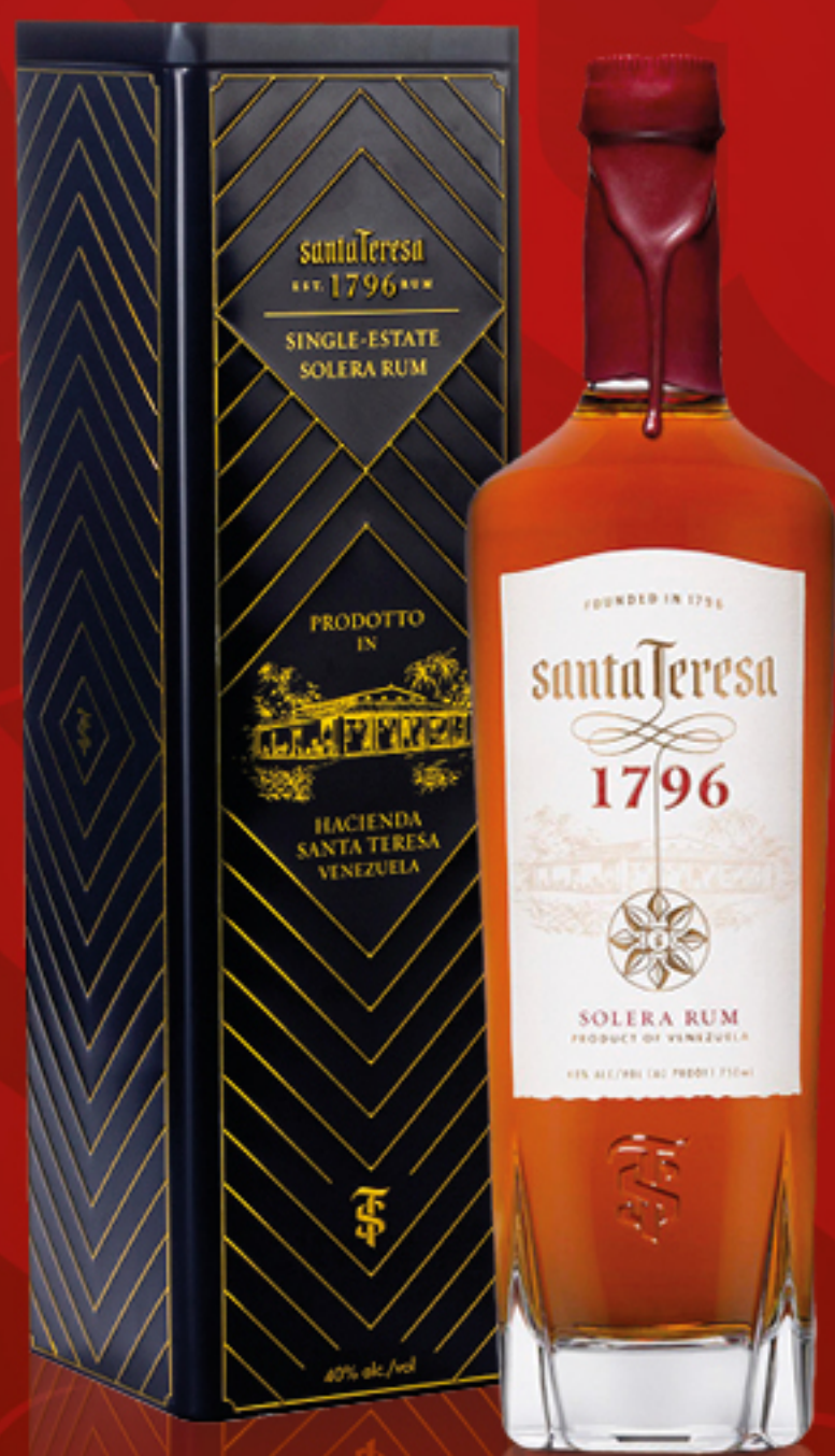
SANTA TERESA RUM 1796 CL 70