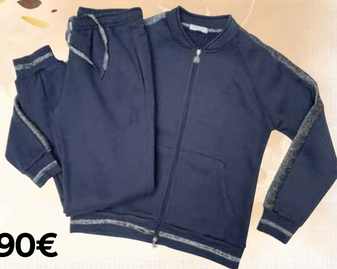
TUTA DONNA LAURA BIAGIOTTI taglie e colori assortiti

Felpe e tute sono un vero passepartout da indossare mattino e sera. Se ti piace l'abbigliamento comodo ma non vuoi rinunciare a uno stile curato, non perdere le offerte Coop. Per te proposte che garantiscono comfort, praticità e prezzi competitivi.