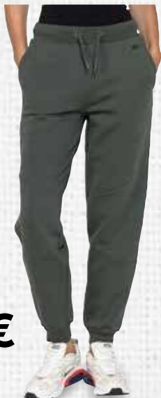
PANTALONI DONNA IN FELPA