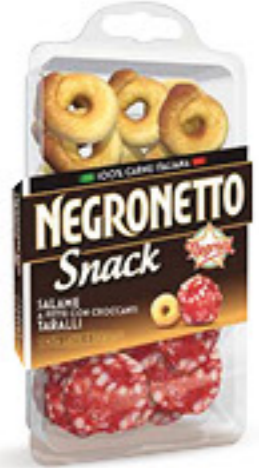
NEGRONI NEGRONETTO SNACK SALAME A FETTE + TARALLI G 85