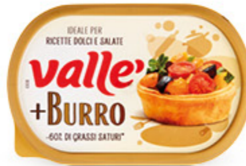
VALLÈ + BURRO G 250