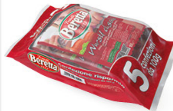
BERETTA WURSTEL CLASSICI DI PURO SUINO 5 X G 100