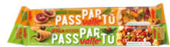
VALLÈ PASTA • SFOGLIA • FROLLA • BRISEÉ G 230