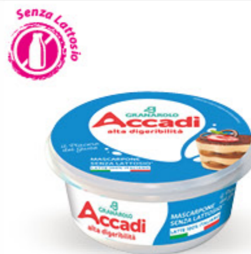
GRANAROLO ACCADI MASCARPONE SENZA LATTOSIO G 250