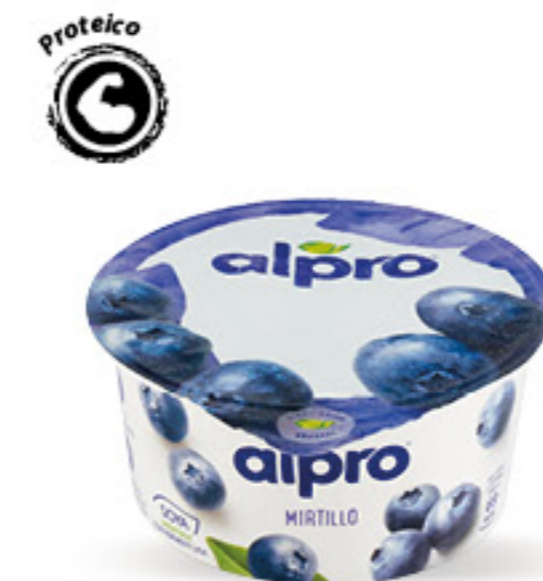
ALPRO YOGURT MIRTILLO G 135