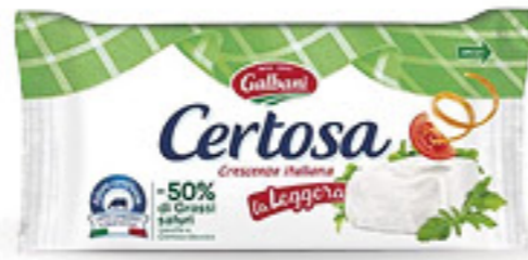
GALBANI CERTOSA LA LEGGERA G 165