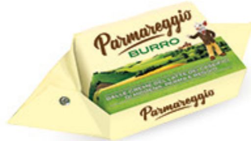
PARMAREGGIO BURRO G 200