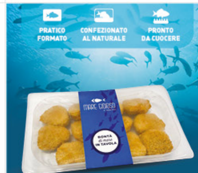
NUGGETS DI MERLUZZO G 300