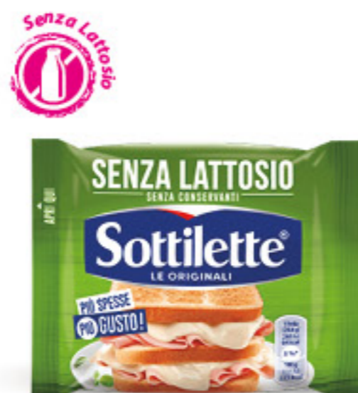
SOTTILETTE SENZA LATTOSIO G 200