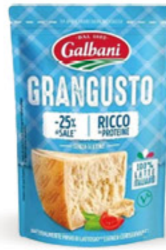
GALBANI GRANGUSTO GRATUGIATO G 90