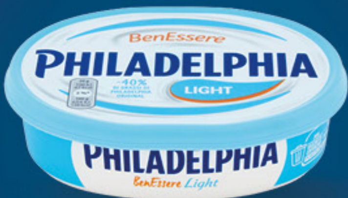
PHILADELPHIA BENESSERE FORMAGGIO FRESCO LIGHT G 175