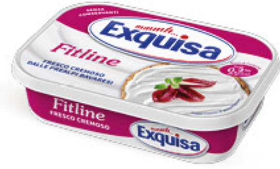
EXQUISA FITLINE FORMAGGIO FRESCO G 175