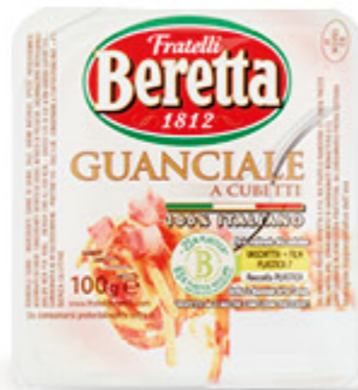
BERETTA GUANCIALE A CUBETTI G 100