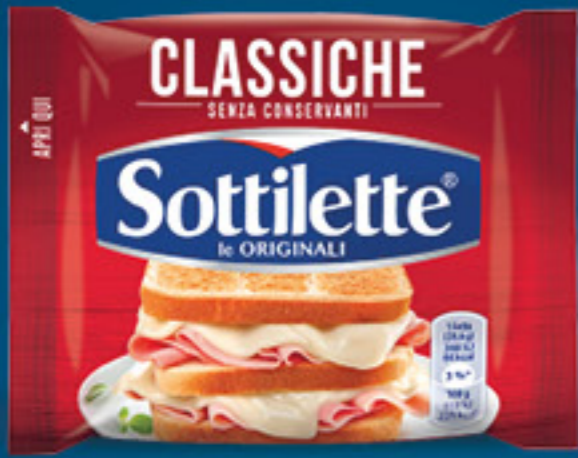
SOTTILETTE CLASSICHE G 200