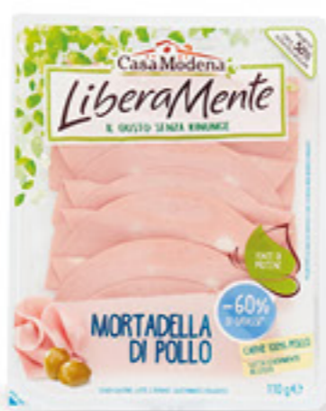
CASA MODENA LIBERAMENTE MORTADELLA DI POLLO G 110