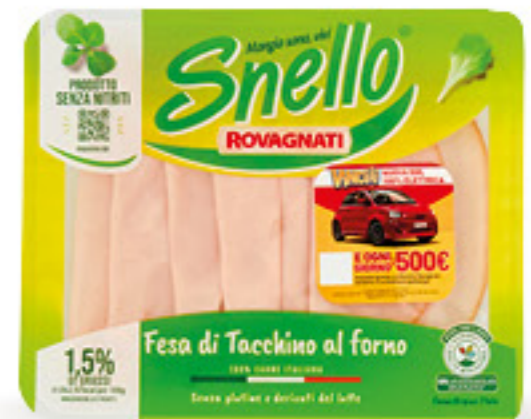
ROVAGNATI SNELO TACCHINO G 70