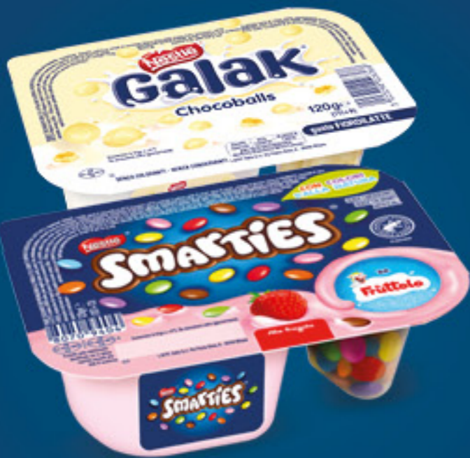
NESTLE FRUTTOLO SMARTIES • FRAGOLA • VANIGLIA • GALAK • CHOCOBALLS G 120