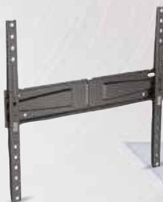
SUPPORTO TV MELICONI 580467 per televisori da 40" a 65"