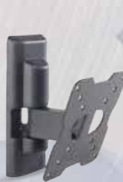
SUPPORTO TV MELICONI 580454 per televisori fino a 25"