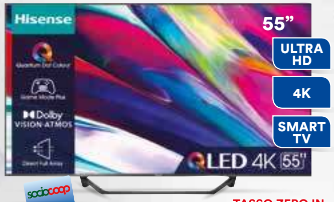
TV QLED 55" HISENSE 55A79KQ TV QD LED. Risoluzione max. 3840 x 2160. Schermo: 16:09. Connessioni: Wi-Fi ed Ethernet. 3 prese HDMI, 2 prese USB 1.1. Classe Efficienza Energetica: G. Cm 123 x 25 x h76,8.