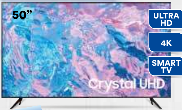
TV LED 50" SAMSUNG UE50CU7170UXZT TV LED. Risoluzione max. 3840 x 2160. Schermo: 16:09. Connessioni: Wi-Fi ed Ethernet. 3 prese HDMI, 1 presa USB. Classe Efficienza Energetica: G. Cm 111,6 x 25 x h71,9.

TASSO ZERO IN 20 rate da 22,45€ Importo totale del credito e dovuto 449€ TAN FISSO 0% TAEG 0%