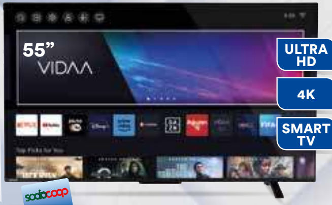
TV 55" TOSHIBA 55UV2363DA Risoluzione max. 3840 x 2160. Schermo: 16:09. 3 prese HDMI, 2 prese USB 2.0. Classe Efficienza Energetica: G. Cm 123,3 x 25,7 x h76.