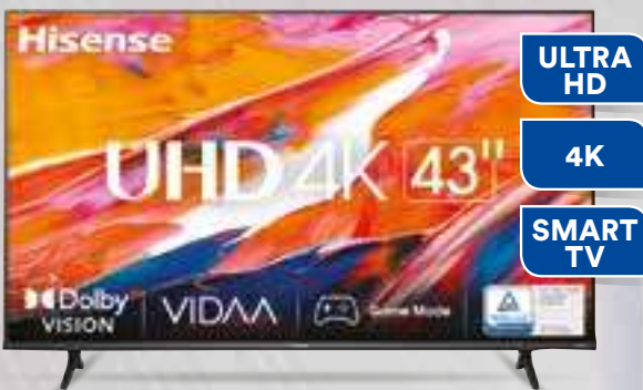
TV LED 43" HISENSE 43A69K Risoluzione max. 3840 x 2160. Schermo: 16:09. 3 prese HDMI, 2 prese USB 2.0. Classe Efficienza Energetica: G. Cm 96,3 x 22,2 x h60,8.