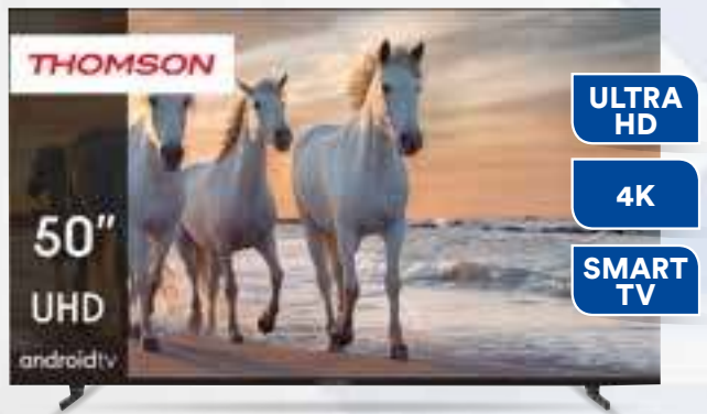
TV LED 50" THOMSON 50UA5S13 Risoluzione max. 3840 x 2160. Schermo: 16:09. 4 prese HDMI, 2 prese USB 2.0. Classe Efficienza Energetica: E. Cm 112 x 26 x h69.

Solo per i SOCI 389,00€ TASSO ZERO IN 20 rate da 19,45€ Importo totale del credito e dovuto 389€ TAN FISSO 0% TAEG 0%