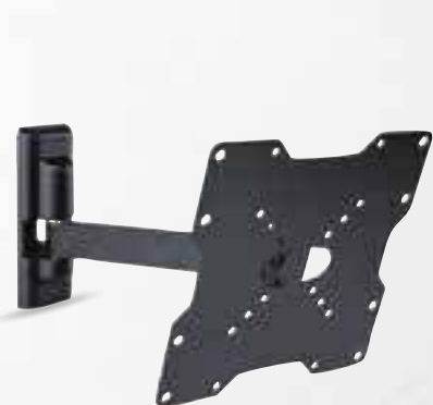
SUPPORTO TV MELICONI 580458 per televisori da 26" a 45"