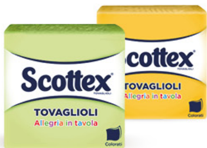
SCOTTEX TOVAGLIOLI COLORATI 2 VELI PZ 33