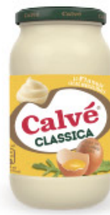
CALVÉ CLASSICA VASO ML 450