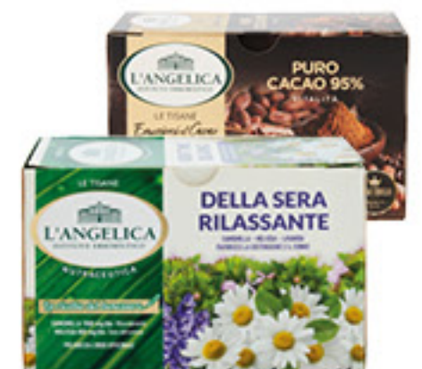
L'ANGELICA TISANE VARI TIPI 15/20 FILTRI