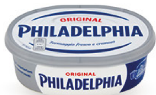
PHILADELPHIA FORMAGGIO FRESCO CLASSICO G 250