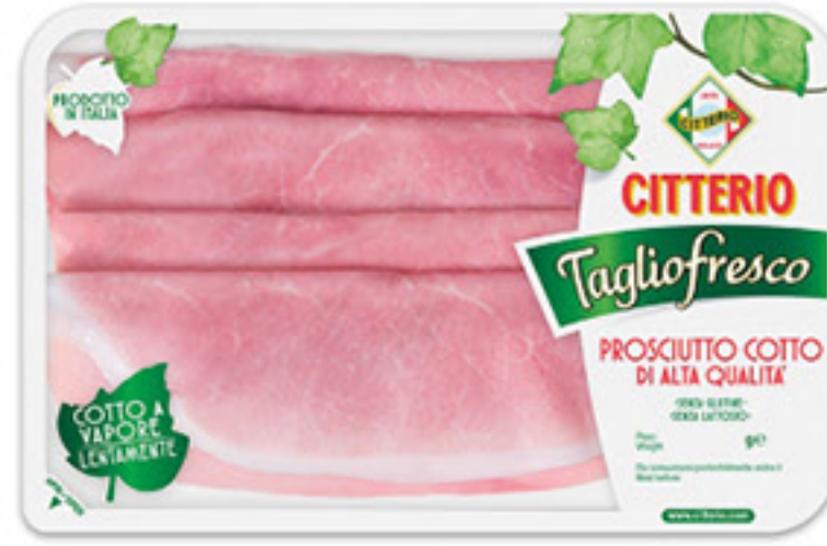
CITTERIO TAGLIO FRESCO PROSCIUTTO COTTO G 100