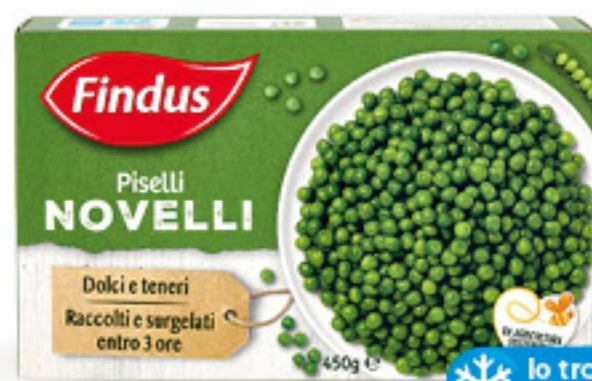
FINDUS PISELLI NOVELLI G 450