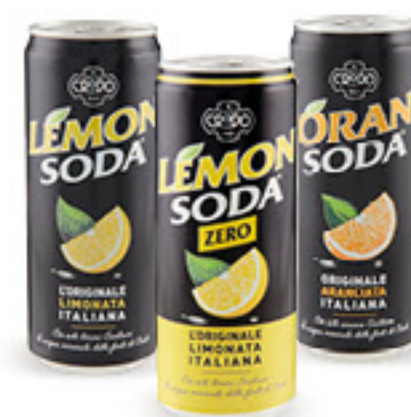
• LEMON SODA - CLASSICA - ZERO • ORAN SODA • MOJITO CL 33