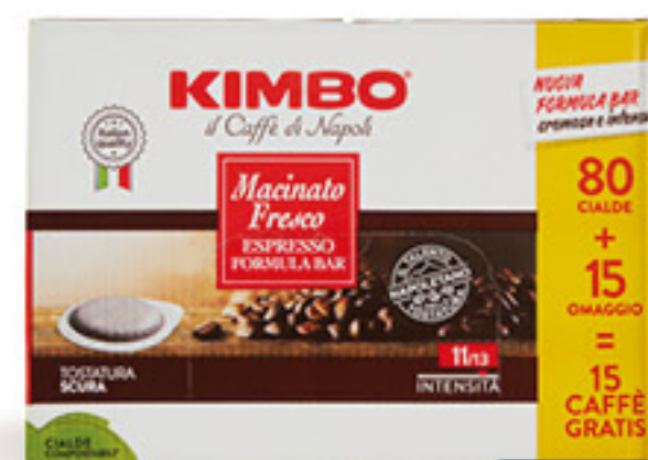
KIMBO MACINATO FRESCO CIALDE 80 + 15 GRATIS