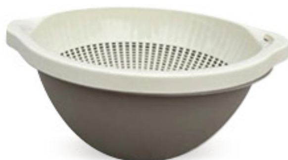
LEGA COLAPASTA CHEF + INSALATIERA ICEBERG CM 26