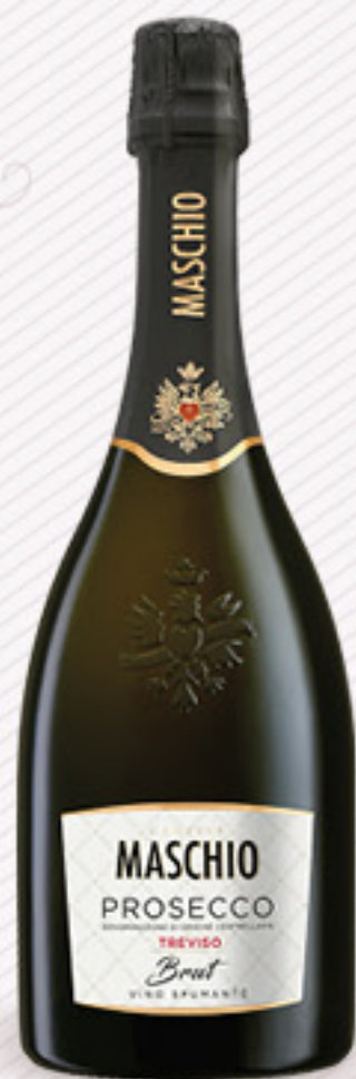
MASCHIO PROSECCO DOC BRUT CL 75