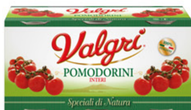
VALGRÌ POMODORINI INTERI TRIS G 400 X 3