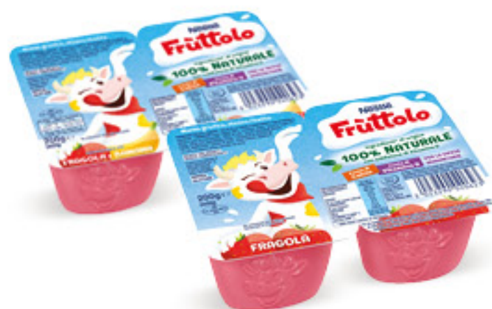
NESTLÉ FRUTTULO 100% NATURALE • FRAGOLA • FRAGOLA E BANANA 4 X G 50