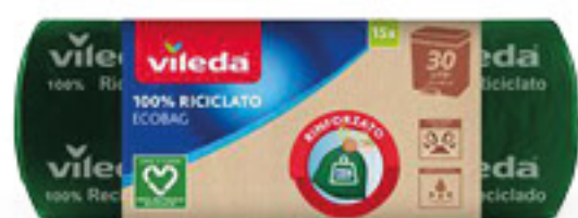
VILED A ECOBAG 100%RICICLABILE PZ 15