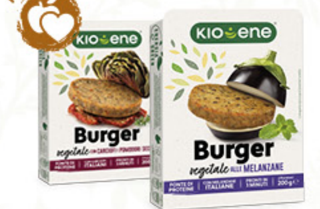
KIOENE BURGER VEGETALE • ALLE MELANZANE • CON CARCIOFI E POMODORI SECCHI • AI FUNGHI 2 X G 100