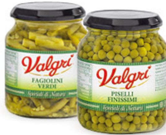
VALGRÌ • PISELLI FINISSIMI • FAGIOLINI VERDI G 340