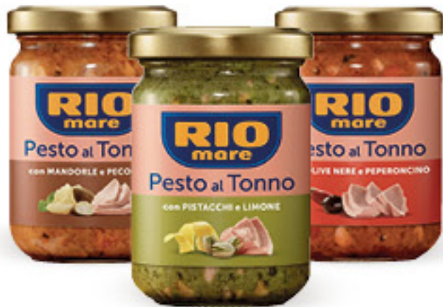
RIO MARE PESTO AL TONNO • OLIVE E PEPERONCINO • PISTACCHI E LIMONE • MANDORLE E PECORINO G 130