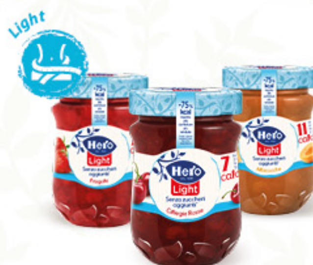
HERO LIGHT CONFETTURE VARI GUSTI G 280