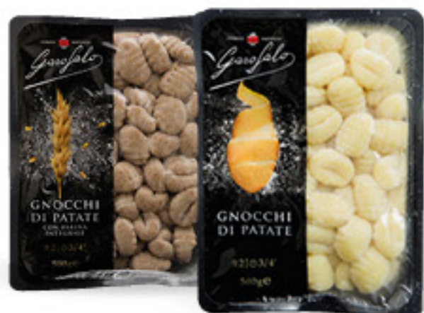
GAROFALO • GNOCCHI DI PATATE - CLASSICI - INTEGRALI • CHICCHE G 500