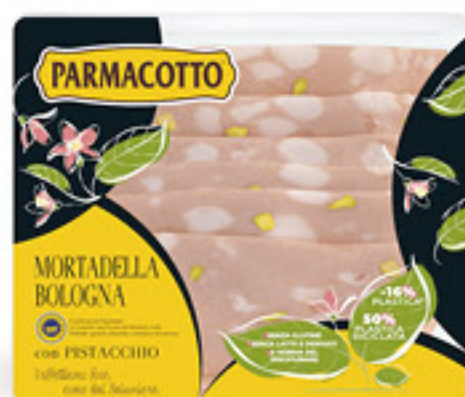
PARMACOTTO MORTADELLA IGP G 120