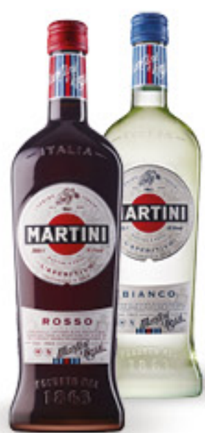
MARTINI • BIANCO • ROSSO L 1