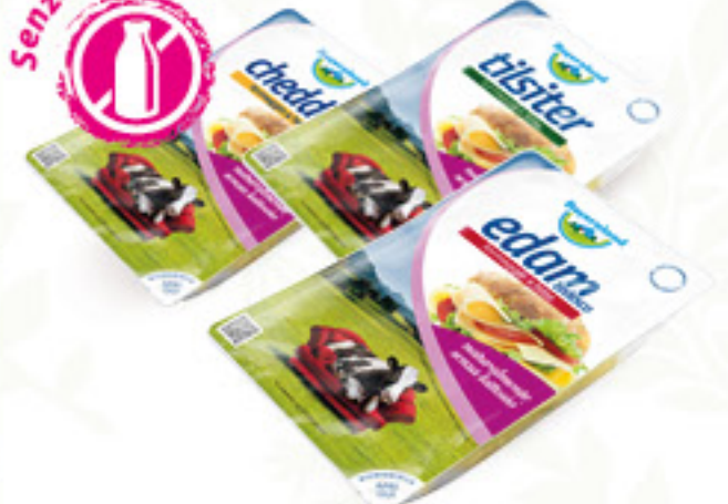
BAYERNLAND FORMAGGIO A FETTE SENZA LATTOSIO • EDAM • EMMENTAL • TILSITER • CHEDDAR G 100