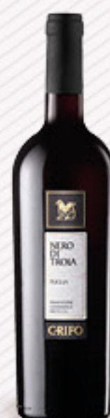
GRIFO NERO DI TROIA IGT CL 75