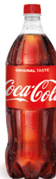
COCA COLA CLASSICA L 1,5