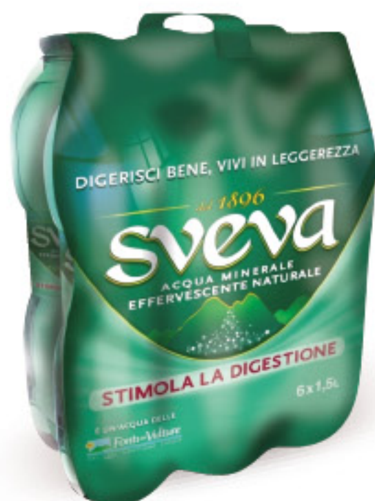
SVEVA ACQUA MINERALE EFFERVESCENTE NATURALE L 1,5 X 6