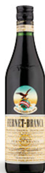
FERNET BRANCA CL 70