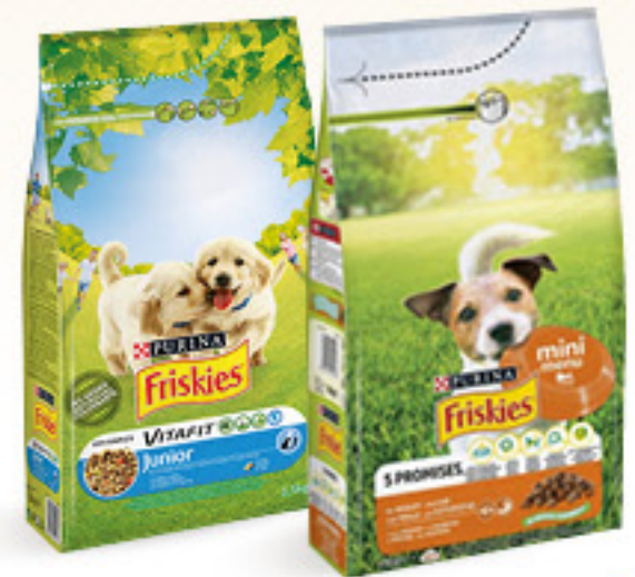
FRISKIES CROCCHETTE PER CANE • JUNIOR POLLO E VERDURE • MINI MENÙ POLLO E TACCHINO KG 1,5