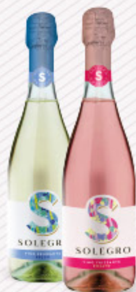
SOLEGRO VINO FRIZZANTE • AMABILE BIANCO IGT • SECCO BIANCO IGT • ROSATO IGT CL 75