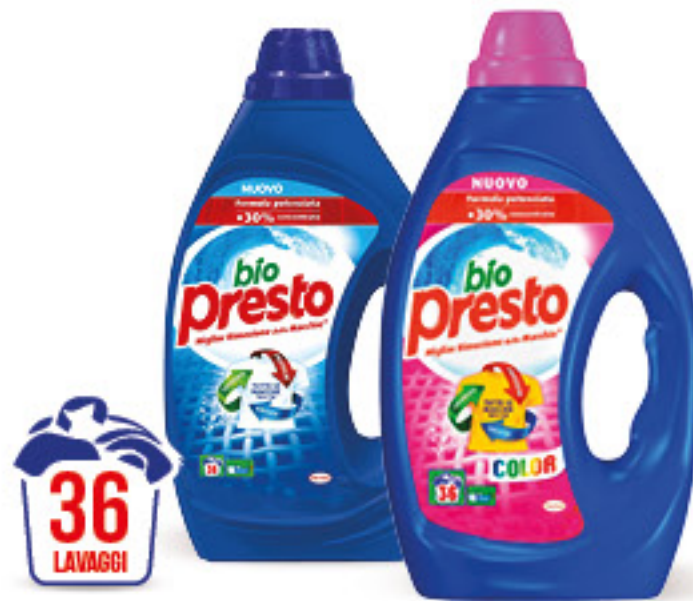
BIO PRESTO DETERSIVO LIQUIDO LAVATRICE • CLASSICO • COLOR • ORCHIDEA 36 LAVAGGI