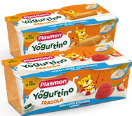
PLASMON YOGURTINO VARI GUSTI 2 X G 100