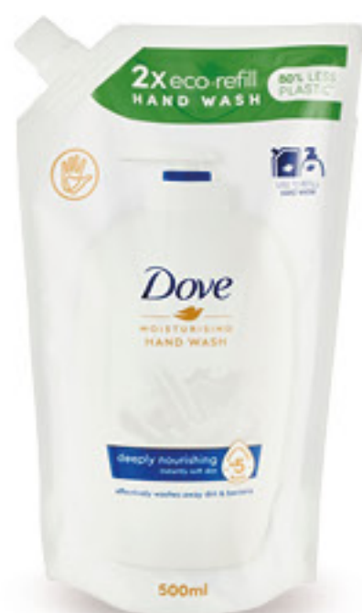
DOVE SAPONE LIQUIDO RICARICA ML 500