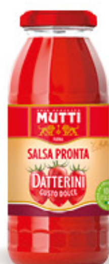
MUTTI SALSA PRONTA DATTERINI G 300