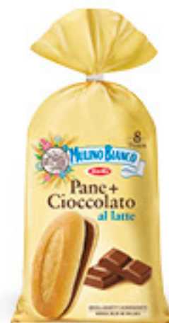
MULINO BIANCO PANE + CIOCCOLATO AL LATTE G 300