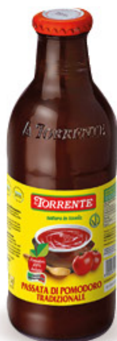
LA TORRENTE PASSATA DI POMODORO IN BOTTIGLIA TIPO BIRRA G 700