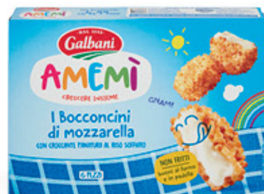
GALBANI AMEMI MOZZARELLA G 150