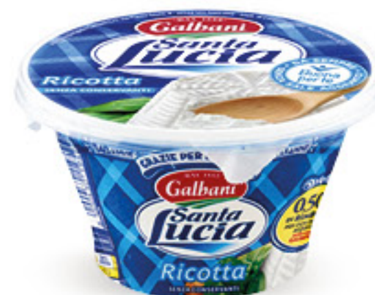
GALBANI SANTA LUCIA RICOTTA G 250