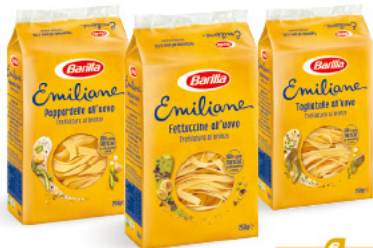
BARILLA EMILIANE PASTA ALL'UOVO VARI TIPI G 250