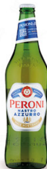
NASTRO AZZURRO BIRRA MAIS NOSTRANO CL 66

SeBón 13,08 AL KG € 4,19 INVECE DI € 5,39