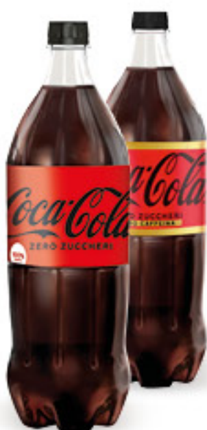
COCA COLA • ZERO CLASSICA • ZERO SENZA CAFFEINA • SENZA CAFFEINA L 1,5