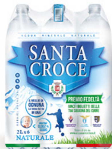
SANTA CROCE ACQUA NATURALE L 2 X 6