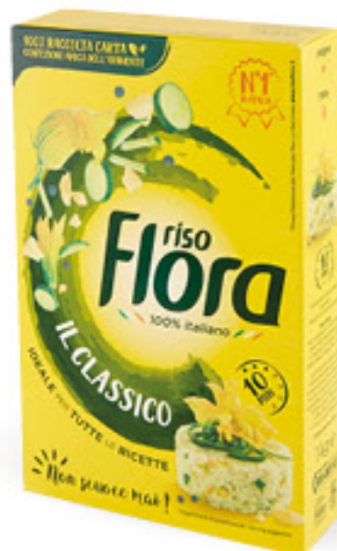
FLORA RISO CLASSICO KG 1