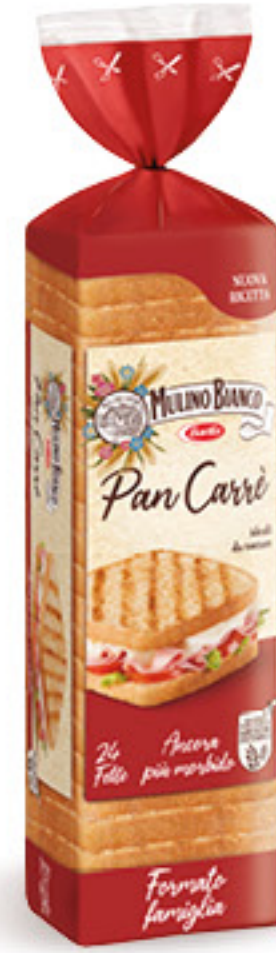
MULINO BIANCO PAN CARRÈ 24 FETTE G 430