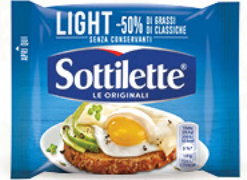
SOTTILETTE LIGHT G 200