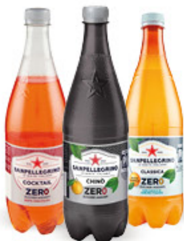
SANPELLEGRINO BIBITE ZERO • ARANCIATA • CHINÒ • COCKTAIL CL 75