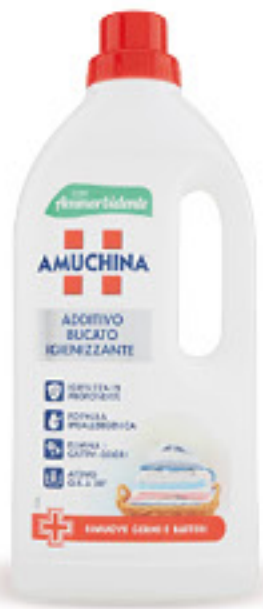
AMUCHINA BUCATO ADDITIVO DISINFETTANTE LIQUIDO CON AMMORBIDENTE L 1