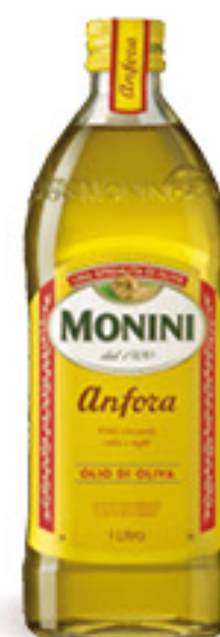
MONINI ANFORA OLIO DI OLIVA L 1