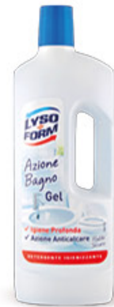
LYSOFORM DETERSIVO AZIONE BAGNO GEL ML 750