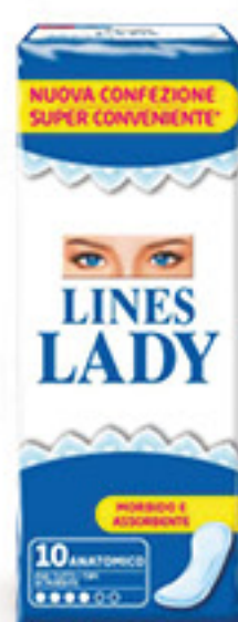
LINES LADY ANATOMICO PZ 10

SeBón 2,53 AL KG € 1,89 INVECE DI € 2,69