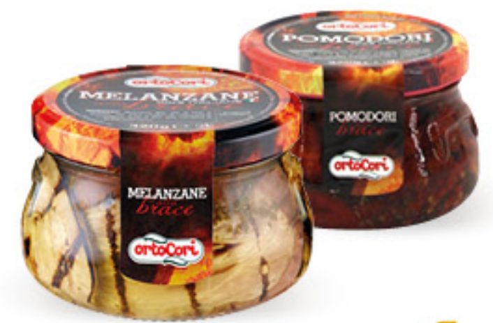
ORTOCORI • MELANZANE ALLA BRACE • POMODORI ALLA BRACE G 320