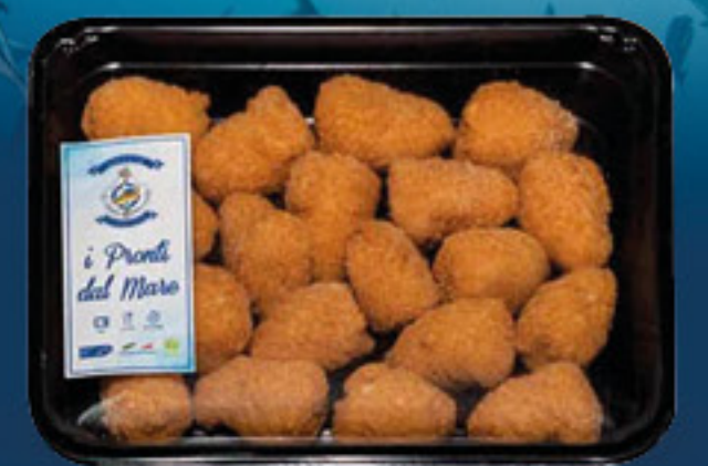
SFIZI DI BACCALA G 350