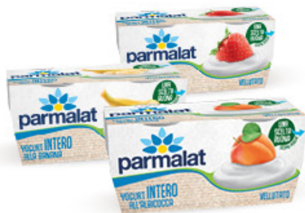
PARMALAT YOGURT VARI GUSTI 2 X G 125