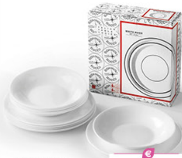
BORMIOLI WHITE MOON SET DA 12 PIATTI (6 PIATTI PIANI + 6 PIATTI FONDI)