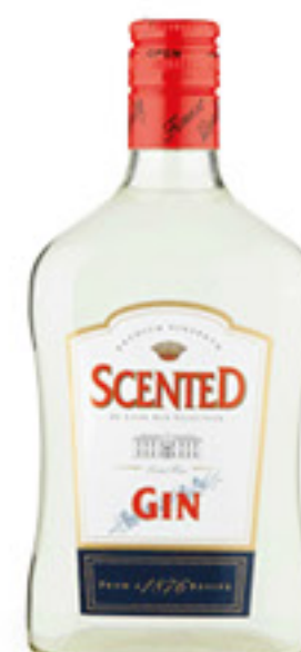
OLDMOOR GIN SCENTED CL 70