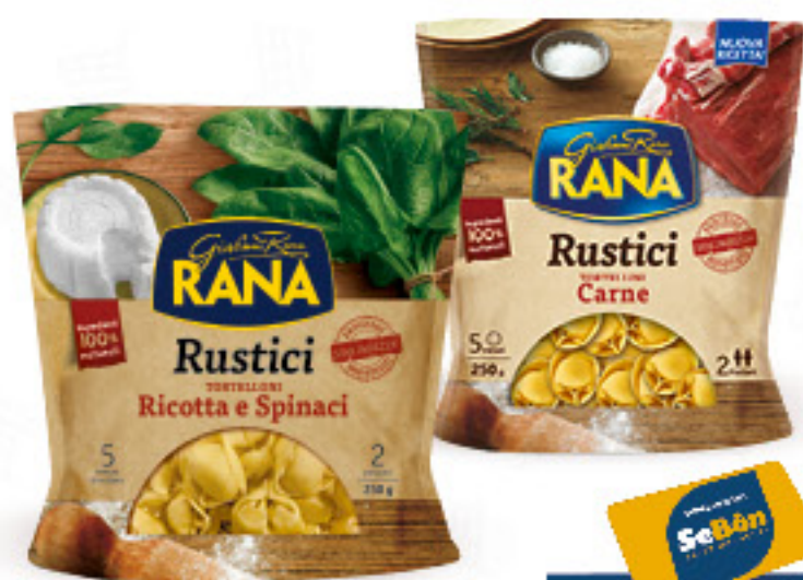
RANA RUSTICI PASTA FRESCA RIPIENA • TORTELLINI • TORTELLONI • CAPPELLETTI VARI GUSTI - G 250

offerte riservate ai possessori di CARTA SEBÓN