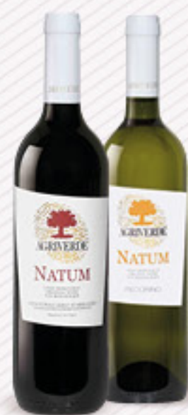
NATUM BIO • MONTEPULCIANO D'ABRUZZO • PECORINO IGT • CERASUOLO DOC CL 75