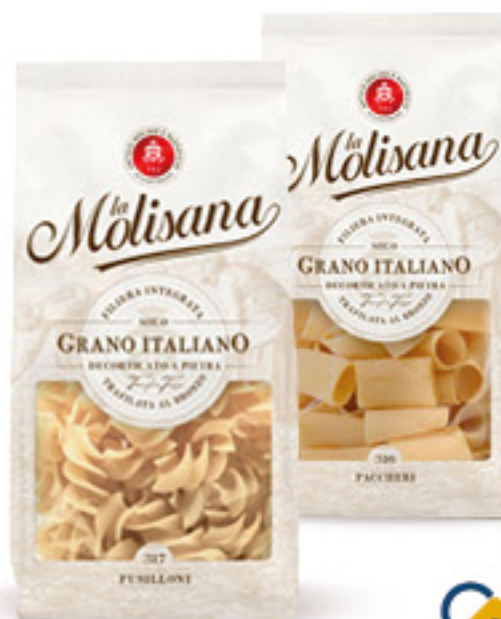
LA MOLISANA PASTA DI SEMOLA LE SPECIALI VARIE TRAFILE G 500