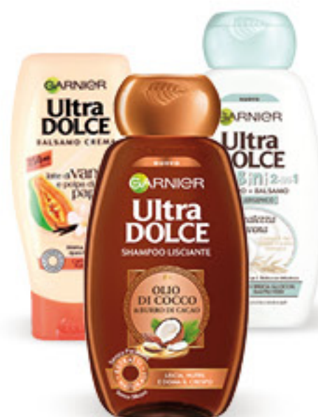
ULTRADOLCE • SHAMPOO ML 300 • BALSAMO ML 250 VARI TRATTAMENTI