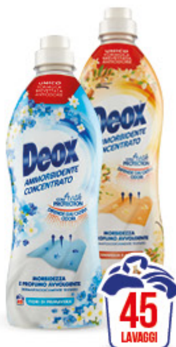
DEOX AMMORBIDENTE CONCENTRATO • FIORI DI PRIMAVERA • VANIGLIA E ARGAN 45 LAVAGGI