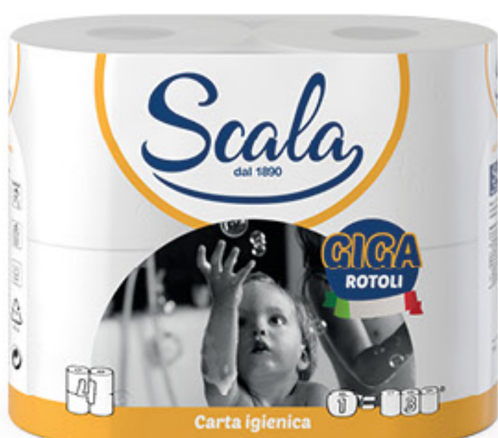
SCALA CARTA IGIENICA GIGA 4 ROTOLI