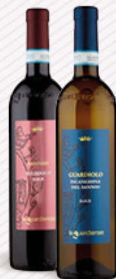
LA GUARDIENSE GUARDIOLO • FALANGHINA DOP • AGLIANICO DOP CL 75