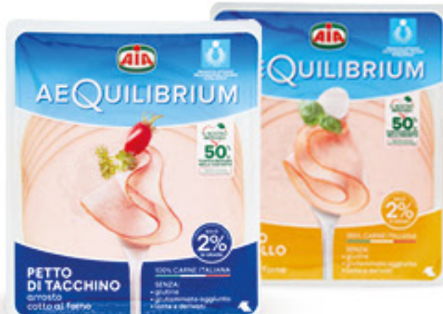
AIA AEQUILIBRIUM • PETTO DI TACCHINO AL FORNO • PETTO DI POLLO G 140