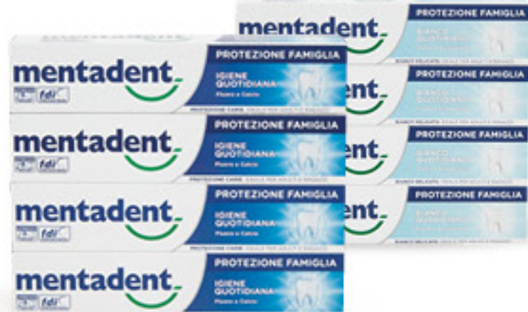
MENTADENT DENTIFRICIO PROTEZIONE FAMIGLIA • BIANCO QUOTIDIANO • IGIENE QUOTIDIANA ML 75 X 4