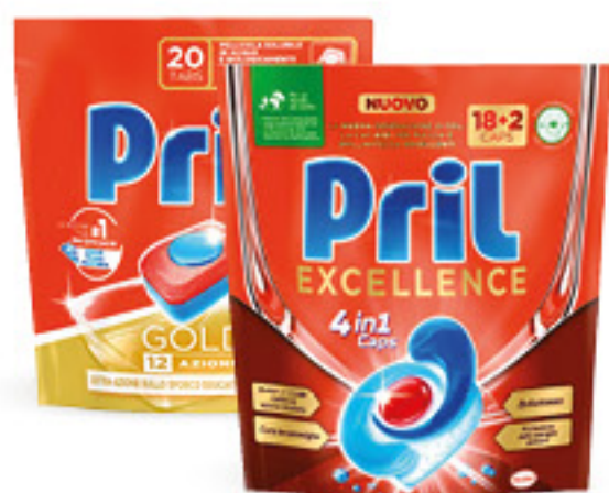
PRIL DETERGENTE LAVASTOVIGLIE • TUTTO IN UNO 26 TABS • GOLD • EXCELLENCE 20 TABS