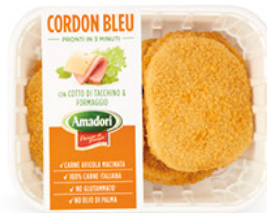
AMADORI CORDON BLEU CON COTTO DI TACCHINO E FORMAGGIO G 500