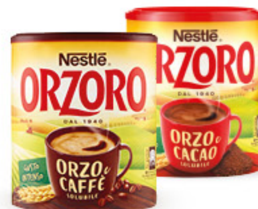
ORZORO ORZO SOLUBILE • CON CAFFÈ • CON CACAO G 120