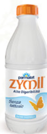
PARMALAT ZYMIL LATTE UHT BUONO DIGERIBILE L 1