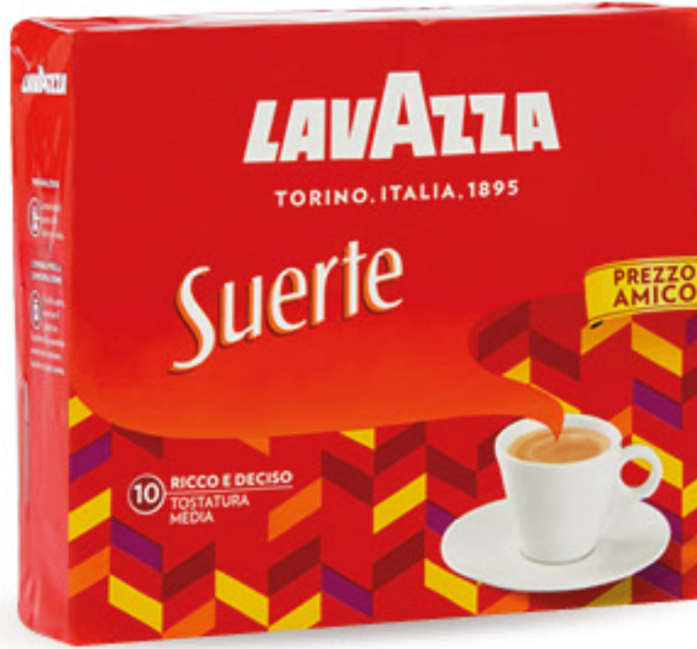
LAVAZZA CAFFÈ SUERTE G 250 X 2