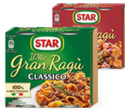
STAR IL MIO GRAN RAGÙ VARI GUSTI G 180 X 2