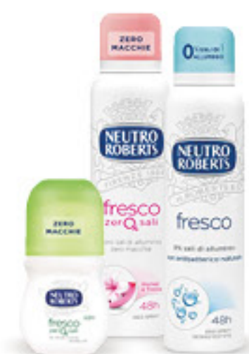
NEUTRO ROBERTS DEODORANTE • SPRAY ML 150 • ROLL ON ML 50 VARI TIPI