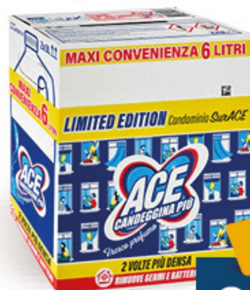
ACE CANDEGGINA PIU' • ARMONIE FLOREALI • FRESCO PROFUMO L 3 X 2