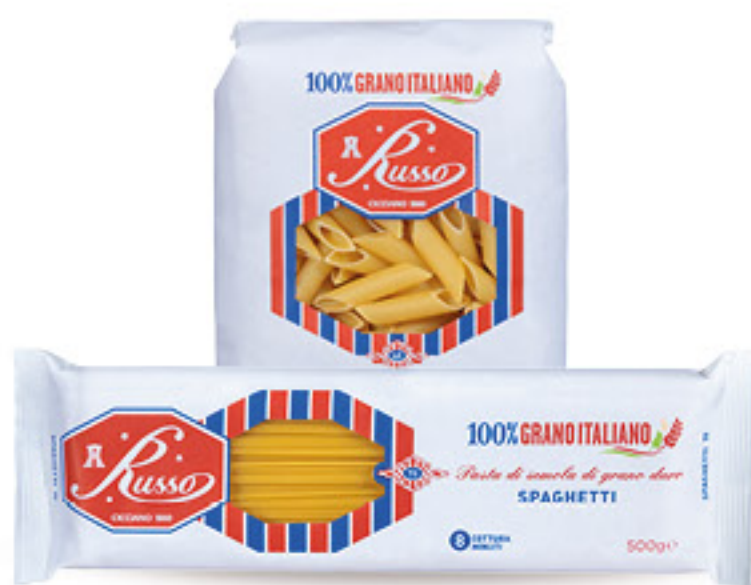
RUSSO CICCIANO PASTA DI SEMOLA FORMATI NORMALI VARIE TRAFILE G 500