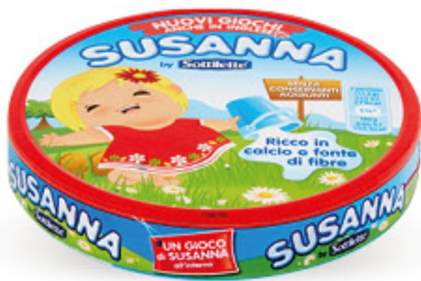
SUSANNA 8 FORMAGGINI G 140