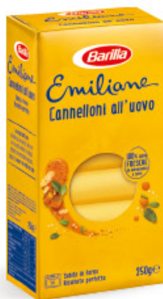
BARILLA CANNELLONI ALL'UOVO G 250