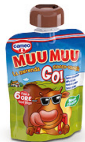
CAMEO MUU MUU GO! BUDINO CIOCCOLATO E VANIGLIA G 80