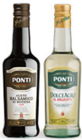
PONTI ACETO • BALSAMICO DI MODENA IGP • DOLCE AGRO ML 500