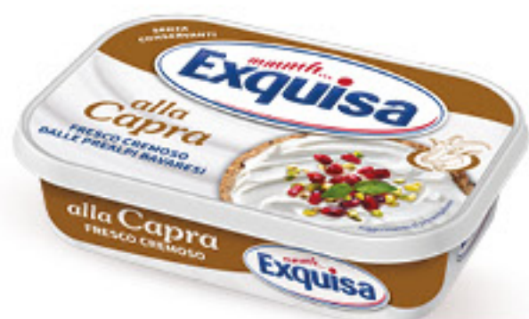
EXQUISA FORMAGGIO SPALMABILE DI CAPRA G 175