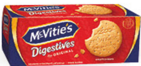
MCVITIE'S DIGESTIVE BISCOTTI CLASSICI G 400