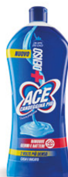
ACE CANDEGGINA DENSO PIU' FRESCO PROFUMO L 1