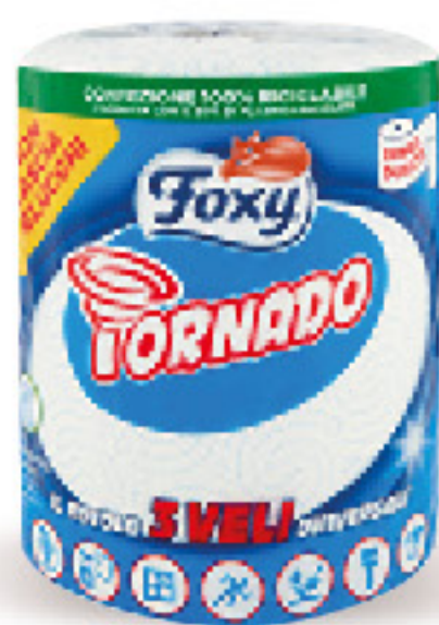
FOXY TORNADO 3 VELI 1 ROTOLO