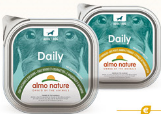
ALMONATURE DOG IN VASCHETTA • VITELLO • TACCHINO • POLLO G 300