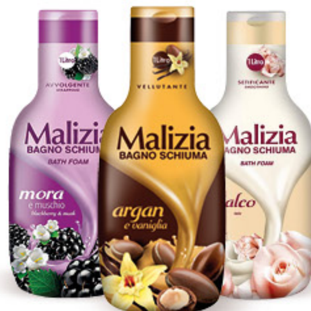
MALIZIA BAGNO SCHIUMA • ARGAN E VANIGLIA • NUVOLA DI TALCO • MUSCHIO E MORA • LATTE L 1