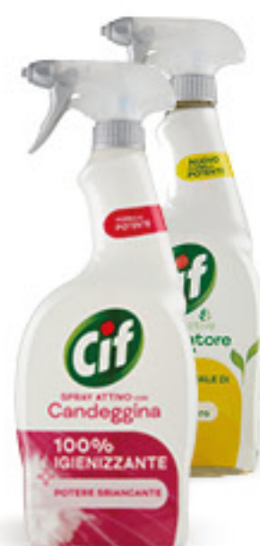
CIF SPRAY SGRASSATORE • GREEN ACTIVE • SPRAY ATTIVO VARI TIPI ML 650