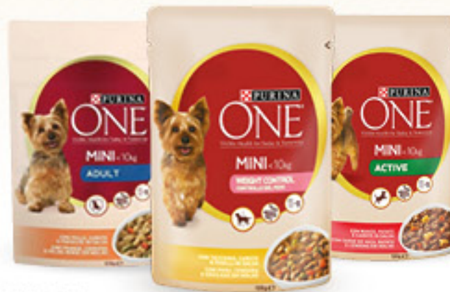
PURINA ONE MY DOG • ADULT POLLO CAROTE E FAGIOLINI • ACTIVE MANZO PATATE E CAROTE • LOVER TACCHINO CAROTE E PISELLI G 100