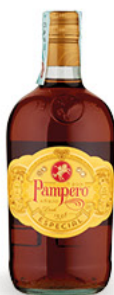
PAMPERO RUM ESPECIAL CL 70