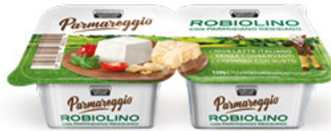
PARMAREGGIO ROBIOLINO 2 X G 60