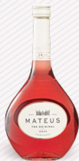
MATEUS ROSE' CL 75