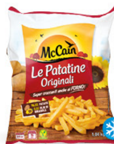
MCCAIN LE PATATINE ORIGINALI KG 1,04