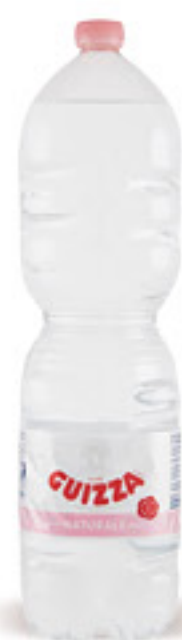
GRAN GUIZZA ACQUA NATURALE L 2