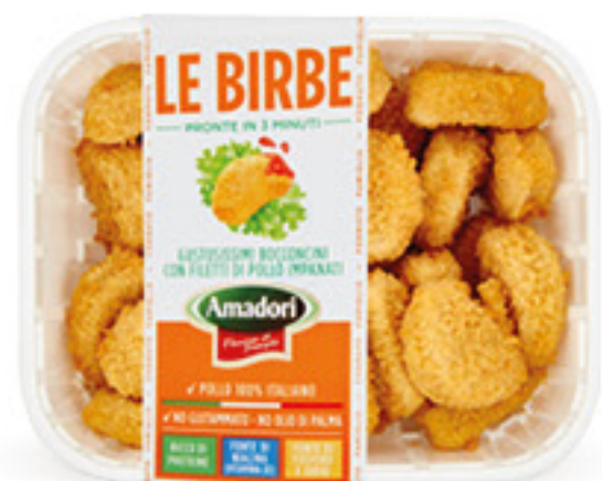
AMADORI LE BIRBE BOCCONCINI DI POLLO G 500