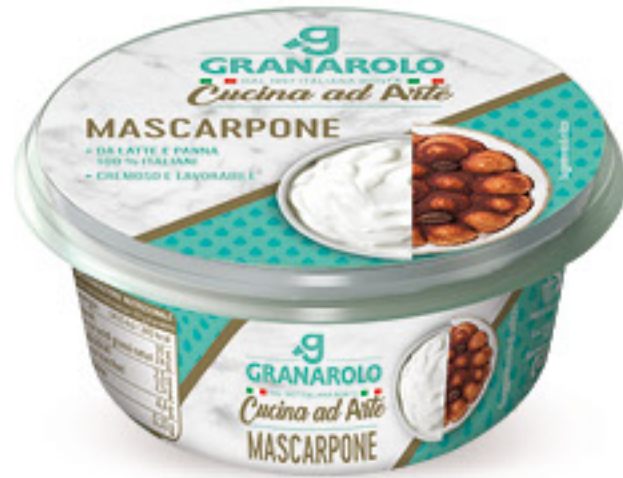
GRANAROLO MASCARPONE CREMOSO G 250