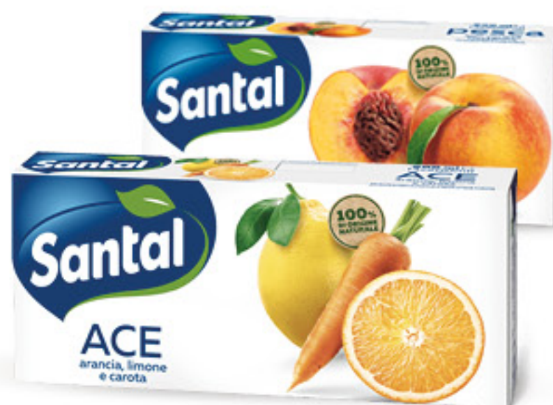
SANTAL SUCCHI DI FRUTTA VARI GUSTI ML 200 X 3