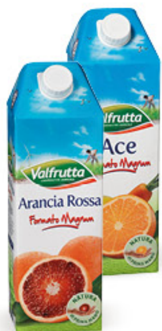
VALFRUTTA SUCCO DI FRUTTA VARI GUSTI L 1,5