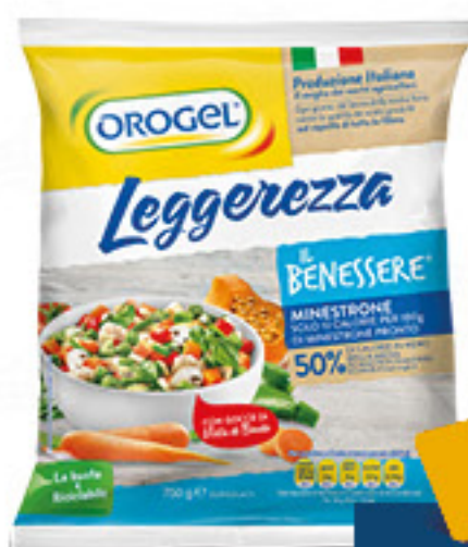
OROGEL MINISTRONE LEGGEREZZA G 750

SeBón 2,53 AL KG € 1,89 INVECE DI € 2,69