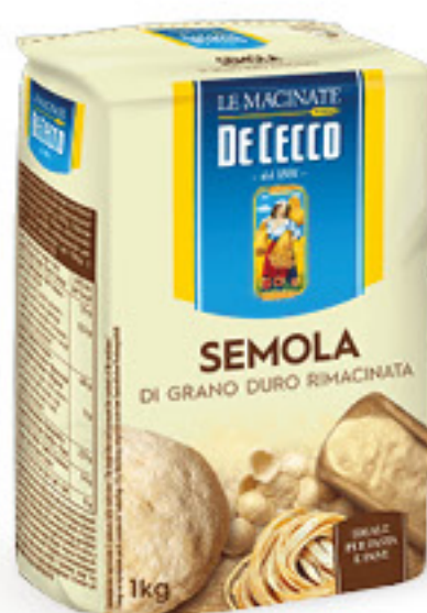
DE CECCO SEMOLA DI GRANO DURO RIMACINATA KG 1