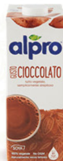
ALPRO BEVANDA CIOCCOLATO L 1