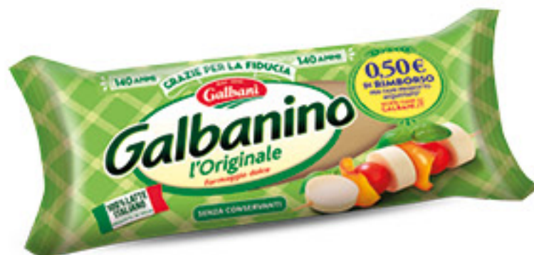
GALBANI GALBANINO G 550