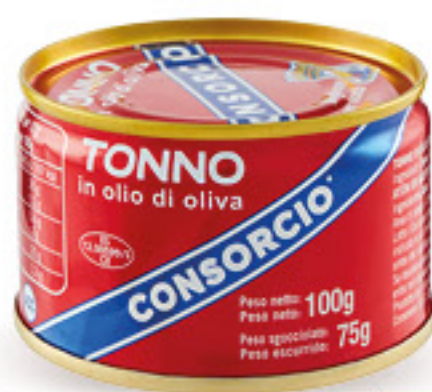
CONSORCIO TRANCI DI TONNO ALL'OLIO DI OLIVA G 100