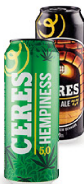
CERES • HEMPINESS 5,0 • STRONG ALE 7,7 CL 50