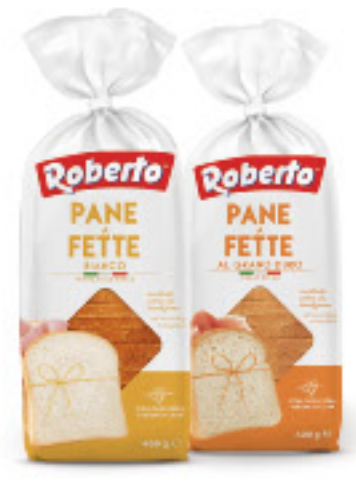
ROBERTO PANE • BIANCO • INTEGRALE • GRANO DURO G 400