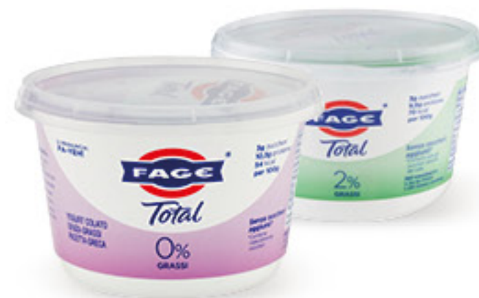
FAGE TOTAL BIANCO • 0% GRASSI • 2% GRASSI • 5% GRASSI G 450