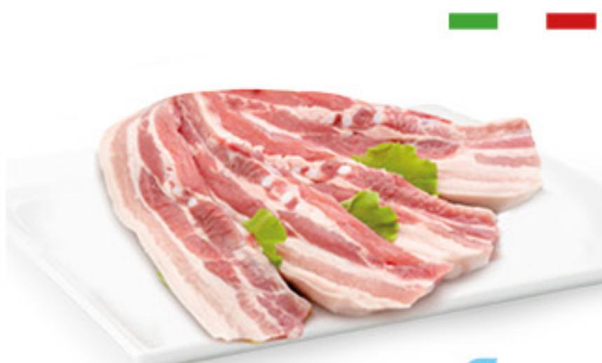
PANCETTA SUINO ITALIANO