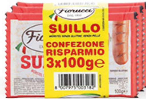
FIORUCCI SUIILLO WURSTEL DI SUINO 3 X G 100