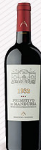
1932 PRIMITIVO DI MANDURIA DOC CL 75