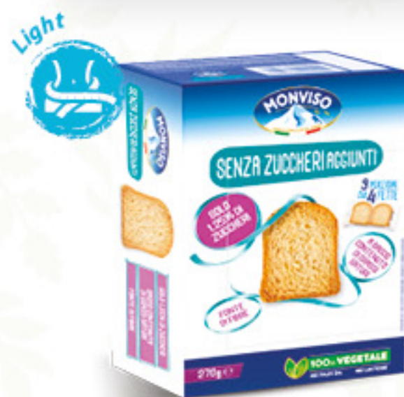
MONVISO FETTE BISCOTTATE SENZA ZUCCHERI AGGIUNTI G 270