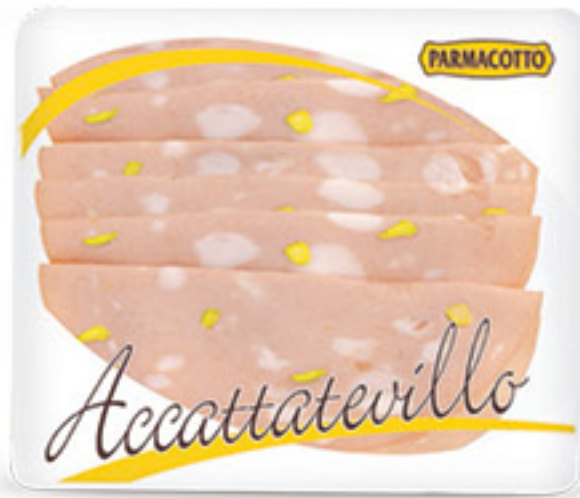
PARMACOTTO ACCATTATEVILLO MORTADELLA G 100