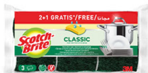
SCOTCH-BRITE SPUGNA VEGETALE 3 PEZZI (2+1 GRATIS)