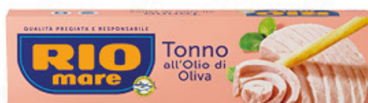
RIO MARE TONNO ALL'OLIO DI OLIVA G 80 X 4

SeBón 7,96 AL KG € 1,99 INVECE DI € 3,69