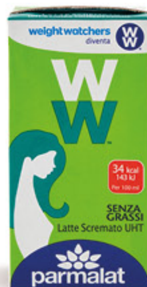
PARMALAT WEIGHT WATCHERS LATTE SCREMATO UHT ML 500