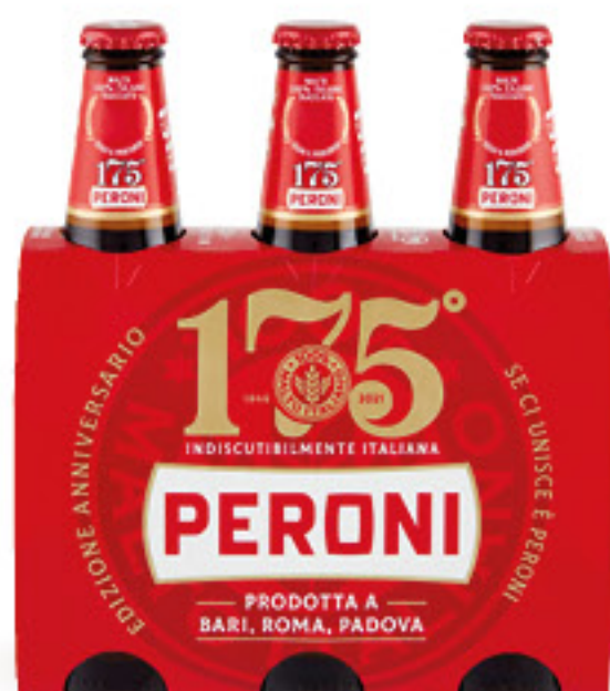
PERONI BIRRA CL 33 X 3